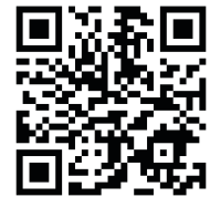
協議会ホームページ

協議会では、多面的機能支払交付金に関する質問や相談をお受けしています。お気軽にお問い合わせください。