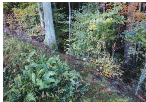
設置した獣害防止柵