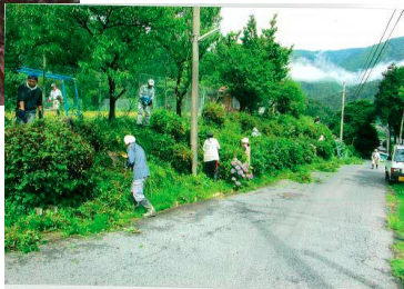
農道の草刈り風景