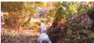
水路の維持管理風景