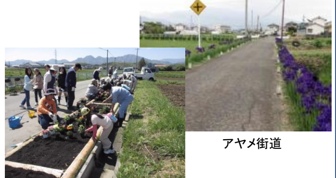
「花ロード」での植栽

●「アヤメ街道」と名付け、農道沿いにアヤメを植栽。また、通学路を「花ロード」として、小学生と保護者を中心に花壇を設置。