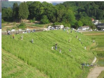
ため池の堤体の草刈り