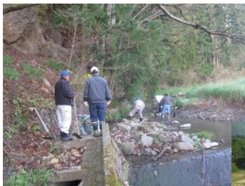
水路の維持管理風景