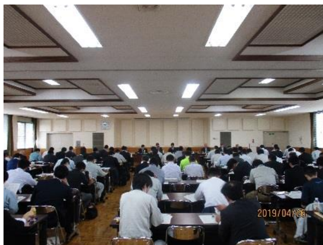
市町村担当者会議の様子 (安曇野市: 県安曇野庁舎)