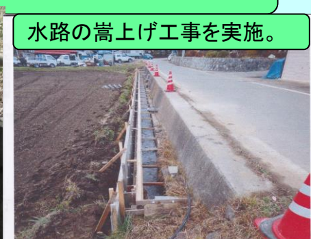
水路の嵩上げ工事を実施。