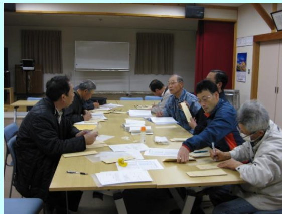
役員会で年度活動計画(案)について検討。