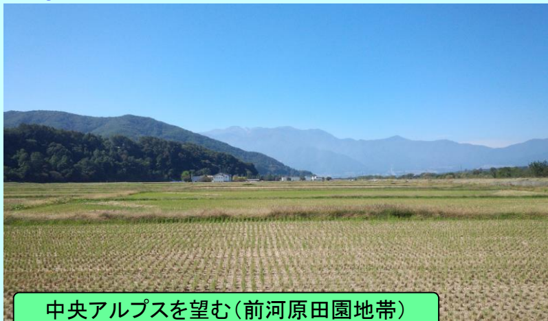
中央アルプスを望む(前河原田園地帯)