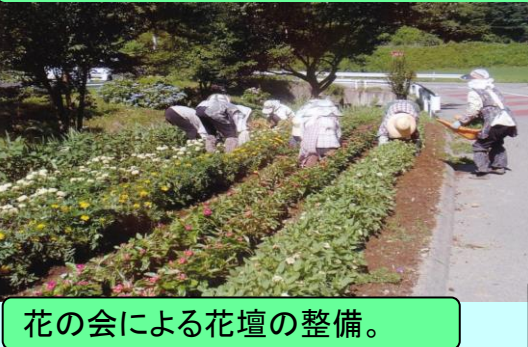
花の会による花壇の整備。