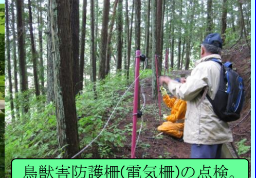
鳥獣害防護柵(電気柵)の点検。