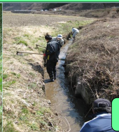
農家・非農家各戸1名が参加して、農道法面の草刈や水路の泥上げ等を実施。