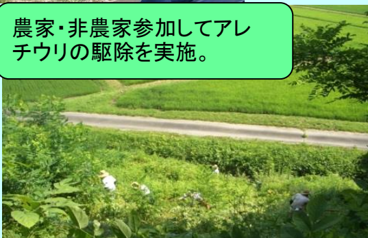
農家・非農家参加してアレチウリの駆除を実施。