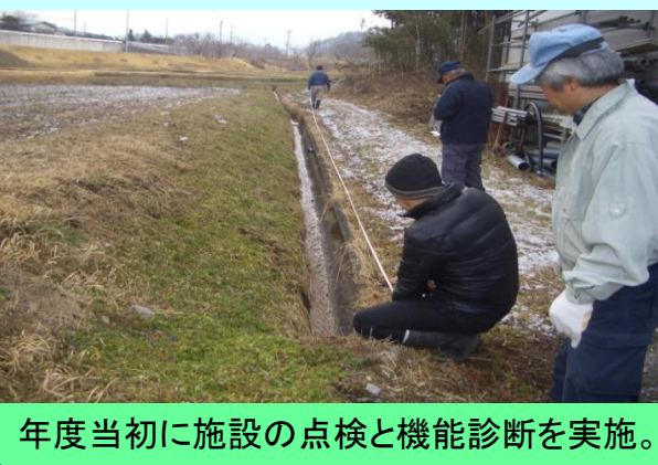
年度当初に施設の点検と機能診断を実施。