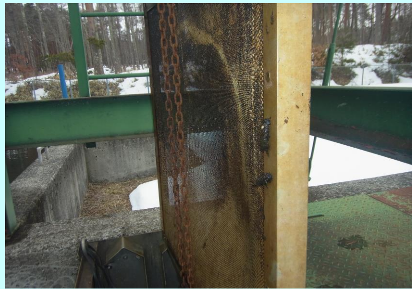
老朽化した施設の維持管理