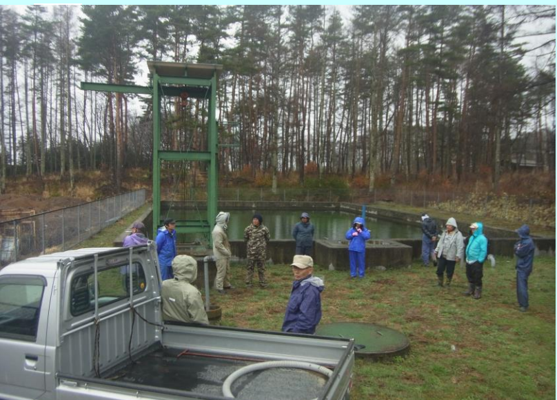
シーズン初めの通水作業