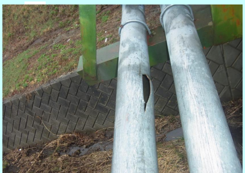
破損個所の点検作業