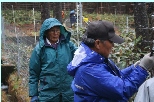
鳥獣害防護柵設置作業