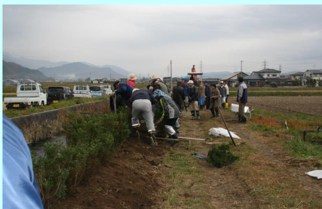
和田川沿いサツキ植栽作業