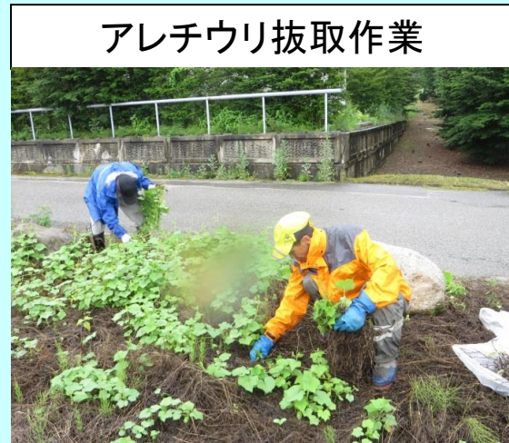
アレチウリ抜取作業