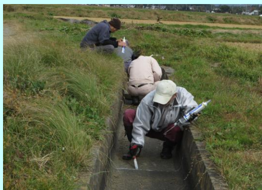
水路目地詰め作業