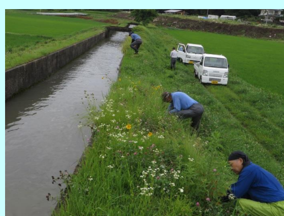
オオキンケイギク抜取作業