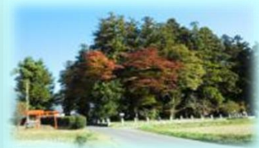
田園風景と鎮守の森