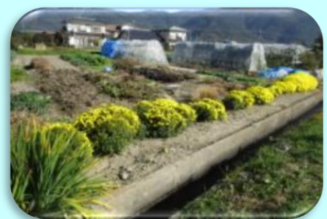
田畑の土手も美しく