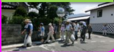
水路巡りウォーク