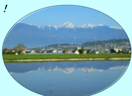
田植えを待つ水鏡田