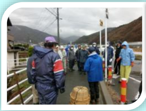
地域ぐるみの水路清掃・泥上げ