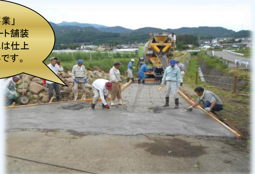
「長寿命化事業」 農道のコンクリート舗装 素人集団の割には仕上がりはプロ並みです。