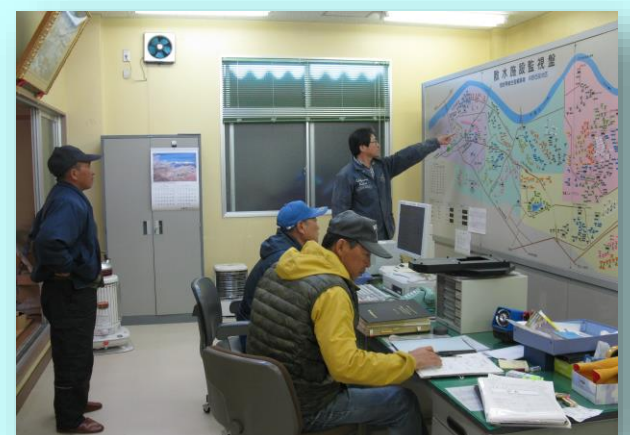
試験散水（大俣管理棟）