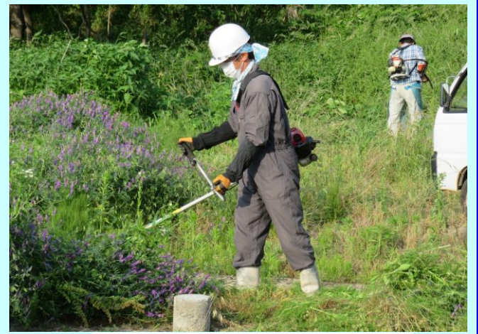
取水口付近草刈り作業