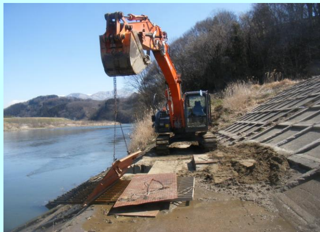
取水口の浚渫作業

また、農用地、畑かん施設等の地域資源並びに畑かん施設の長寿命化に取り組んでいます。