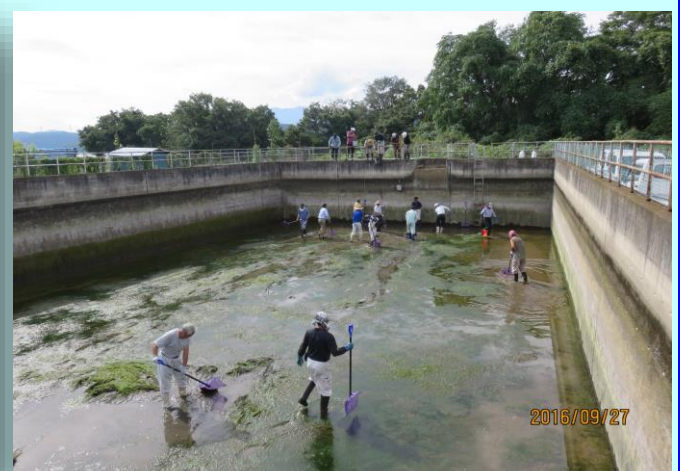
調整池の泥上げ作業