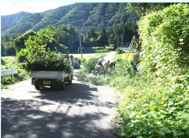
農道上 通行に支障がある木を伐採 高所作業もあり慎重に。