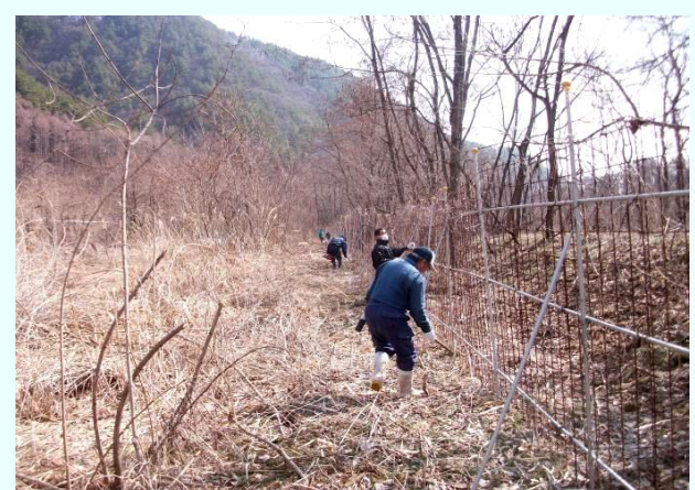
獣柵点検及び適正管理 蔓、枝の処理。割り当てで。