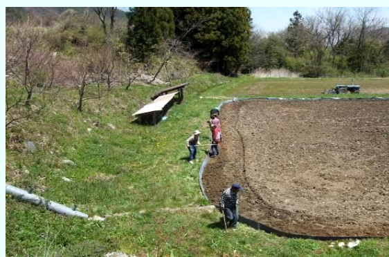
若者の農業参加の お手伝い