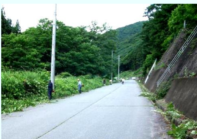
水路の草刈作業 一人一人の間隔を考えて安心安全に。