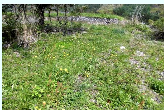
ある日本タンポポの 群生地の手