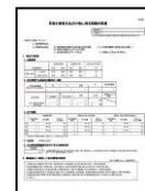
事業計画書の審査支援

※活動組織の中間管理指導は、市町村が実施する実績の事前確認指導に併せ実施することを検討中