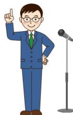
平成27年度通常総会 (長野市:土地改良会館)