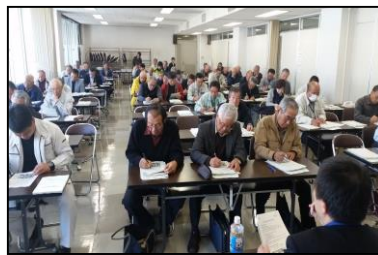
事務研修会 県下14会場