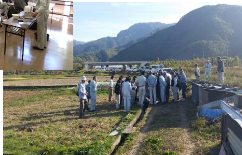
現場での補修の実地の様子