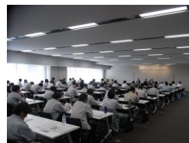
県・市町村担当者会議[10月20日 安曇野市役所]