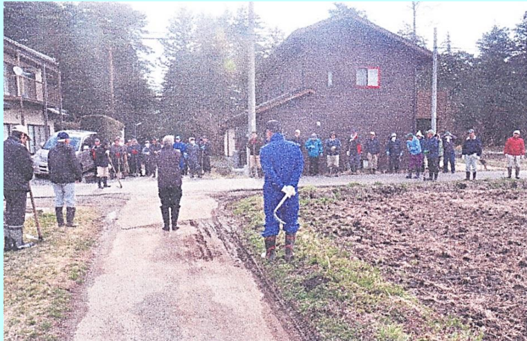
毎年恒例の西天地区(灌漑面積60ha、水路延長16k)を組合員全員で春の水路清掃作業を行います