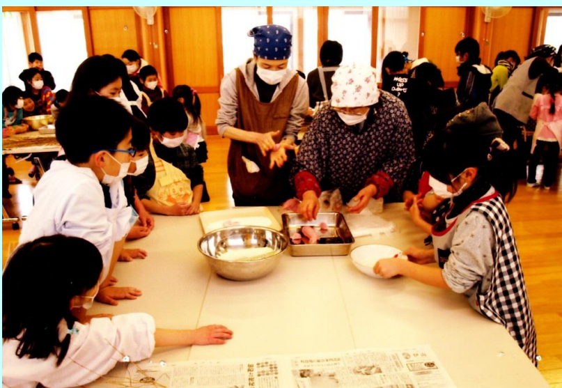
小正月には地域の高齢者と小学生と一緒に「まゆだま様」を作り農作業の安全と豊作を祈願しました

できあがった「まゆだま様」を前に農家の人達がどんな思いで作ったのかおばあさんより話を聞く小学生達