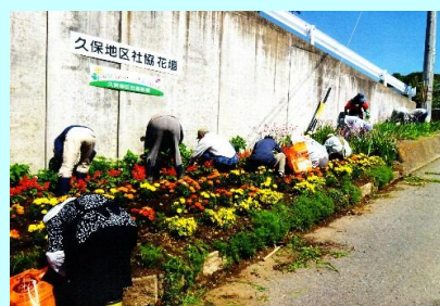
地区社会福祉協議会が区内の集落内に3ヶ所の花壇を管理して春より秋迄すばらしい花を咲かせています