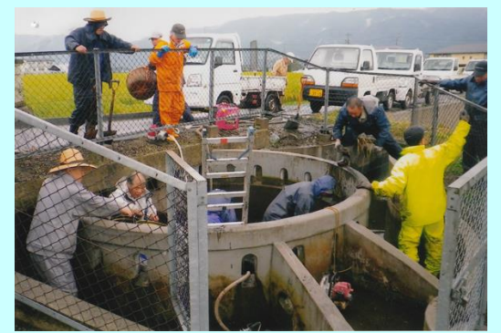
西天竜の貴重な「円筒分水」の止水後の泥上げ