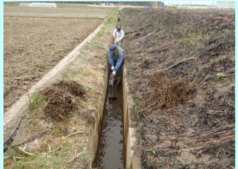
用排水路の点検と整備