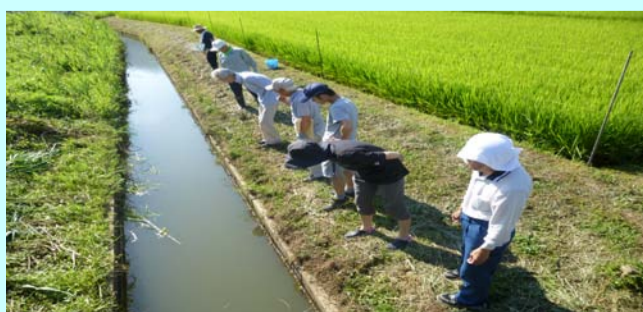
区民全員対象メダカの学校