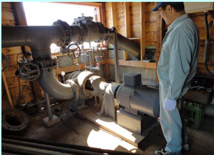
揚排水ポンプの点検