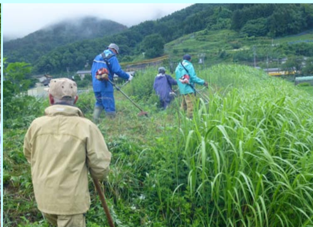
区民全員出労で境堤防法面の草刈り