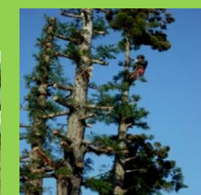
日蔭林の伐採・枝打