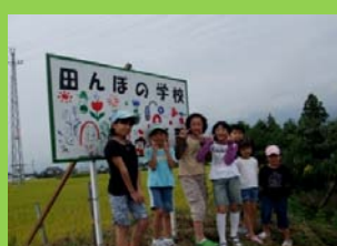
子供育成会の田んぼの学校