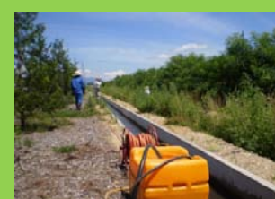
ニセアカシア駆除