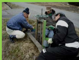
水門のペンキ塗り