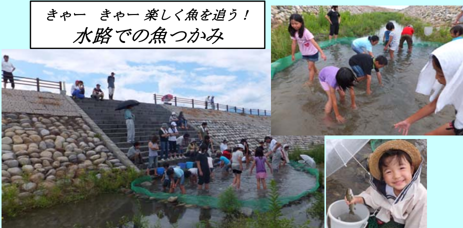
きゃー きゃー 楽しく魚を追う！ 水路での魚つかみ