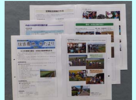
活動の内容や活動計画を周知 広報紙