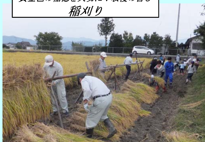
黄金色の稲穂を大切に！収穫の喜び 稲刈り