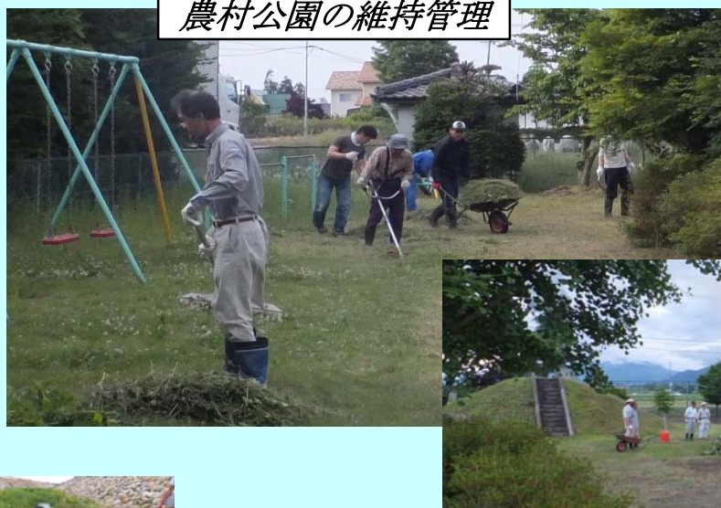
除草や樹木の枝払い 農村公園の維持管理