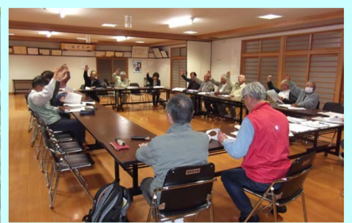
役員会での 真剣な討論状況