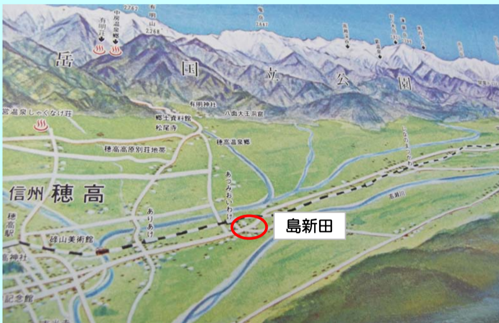
北アルプス山麓の穀倉地帯