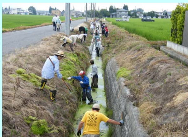
住民全員参加による 泥上げ作業