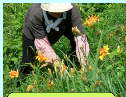
在来植物の保全にも力を注ぎます