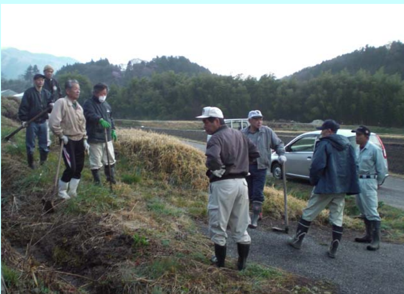
集落員・自治会員・下西集落民で地区内巡回を行い、快適な生活の維持に努めます