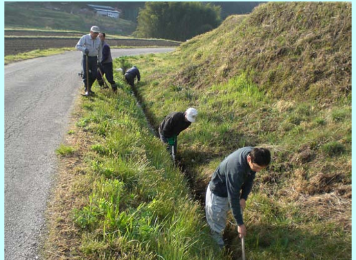
道路や水路の早期維持補修に努めます