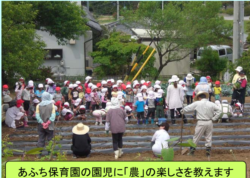
あふち保育園の園児に「農」の楽しさを教えます