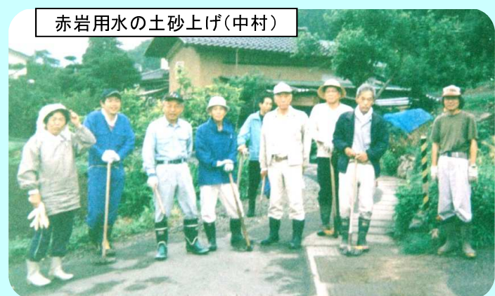
赤岩用水の土砂上げ(中村)