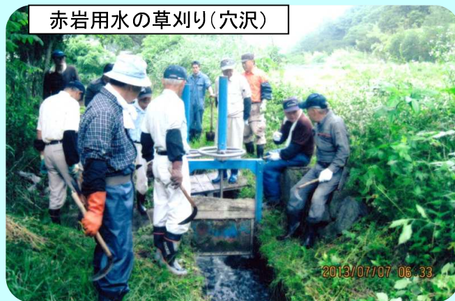
赤岩用水の草刈り(穴沢)