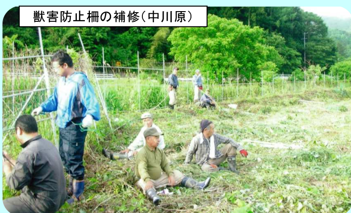
獣害防止柵の補修(中川原)