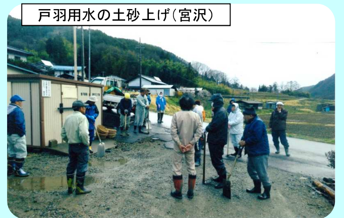
戸羽用水の土砂上げ(宮沢)