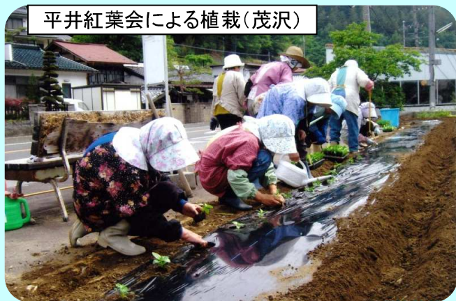
平井紅葉会による植栽(茂沢)