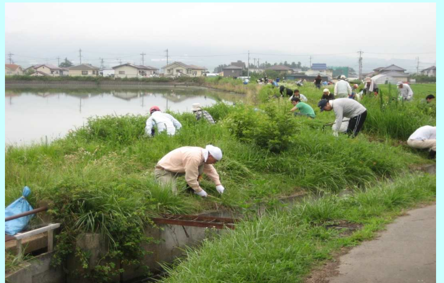
7月下旬 ため池の草刈り →

このような活動を通して、中野のため池は、農業者だけでなく自治会全員の物であり、今後も管理していかなければならないという意識が芽生えています。