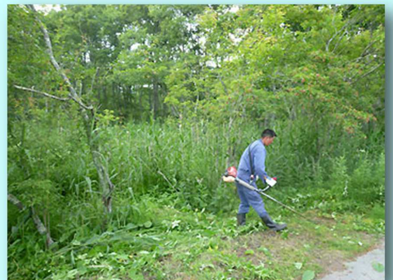
農地と湿原の間の除草作業