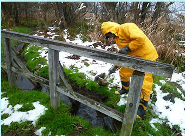
極寒の中、堆積した土砂を取り除く作業