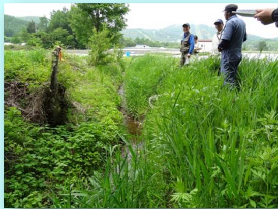
水路の現況調査・・・水路の法面が崩れ、水が対流し上流からの水を堰き止め、水害をもたらした箇所