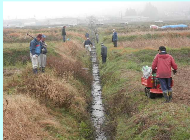
三ヶ沖排水路の補修