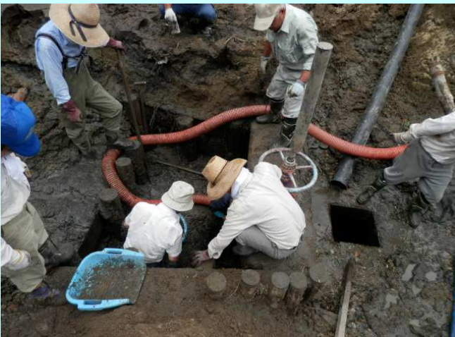
平井寺池底樋の泥上げ