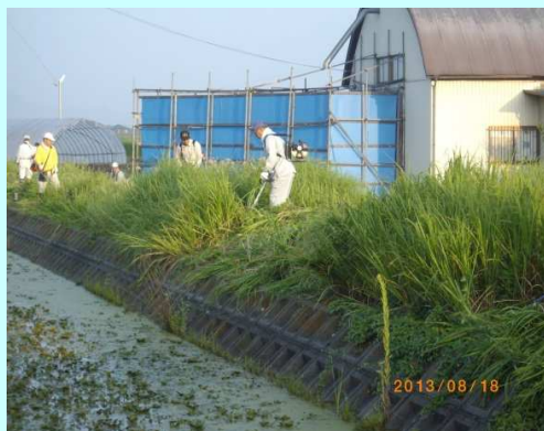
ため池 土手の草刈り