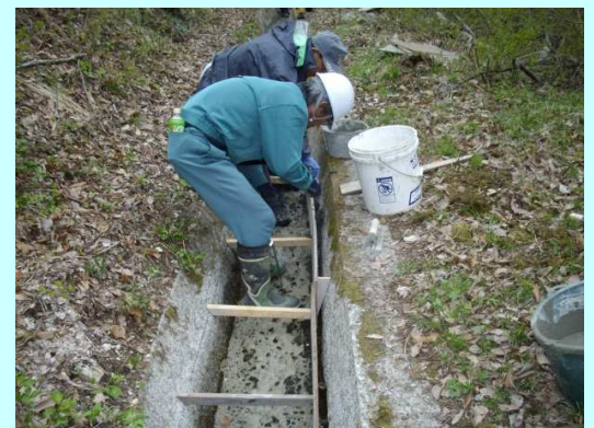
用水路 破損箇所の補修