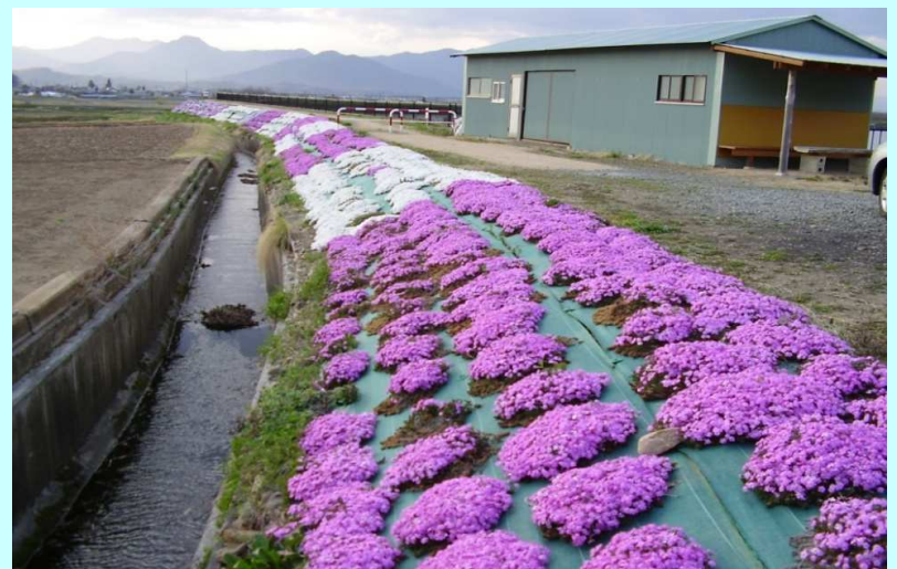
ため池土手の草刈り省力化と美化（芝桜の植栽）